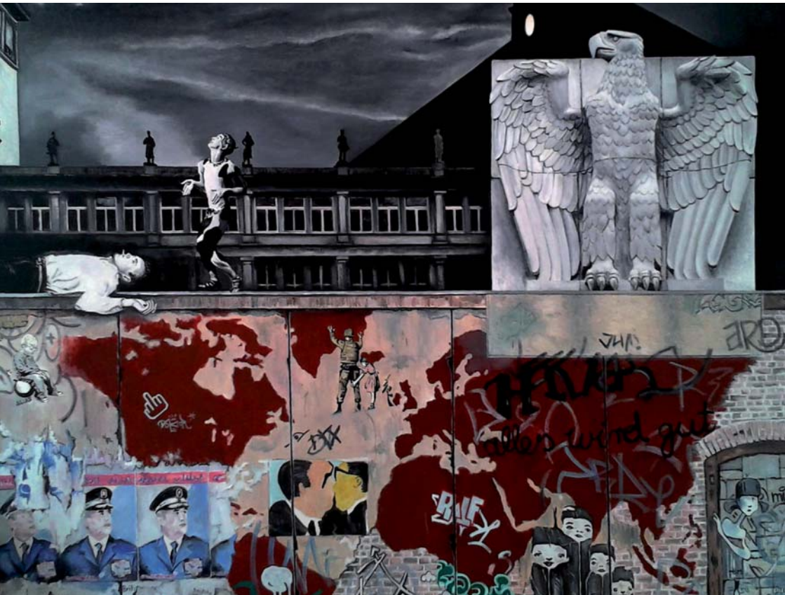
Constantin Schroeder „Mauer“ (2010) | 180 x 180 cm | Öl auf Leinwand