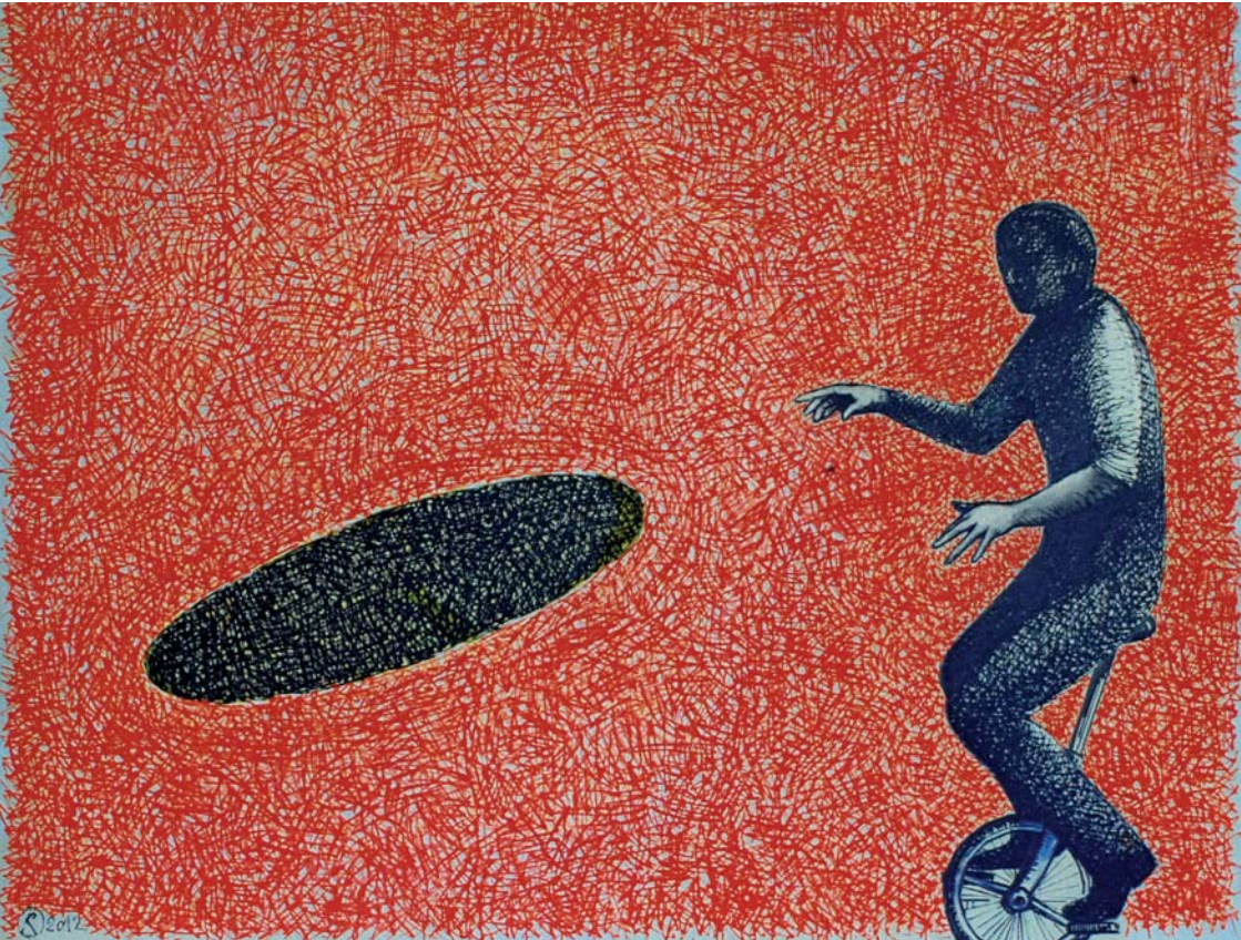
RADOMIR „12/19“ (2012) | 190 x 240 cm | Öl auf Leinwand