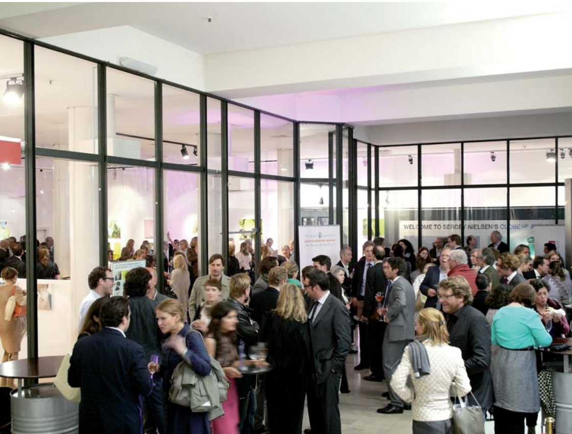
CCA&amp;A GALLERY | Vernissage Sergei Sviatchenko im Kaufmannshaus | HAMBURG ART WEEK 2011