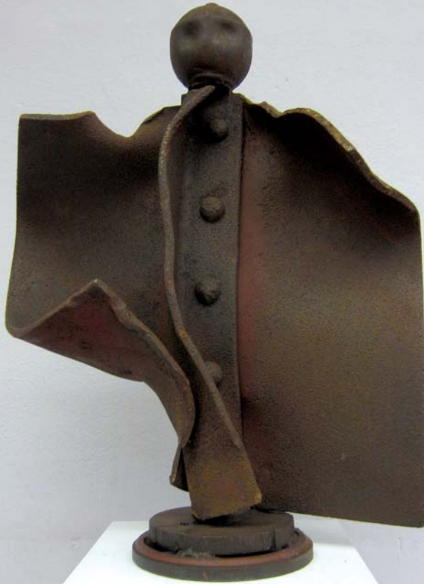
Roberto Spadoni „La forza sia con te“ (2005) | Höhe: 67 cm | Stahlträger